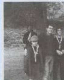
Alcuni momenti dell'inaugurazione