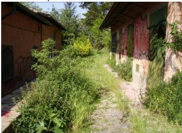
La situazione “prima”